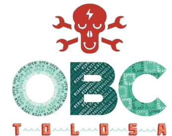
Open Bidouille Camp Toulouse - Affiche 2016 & logo